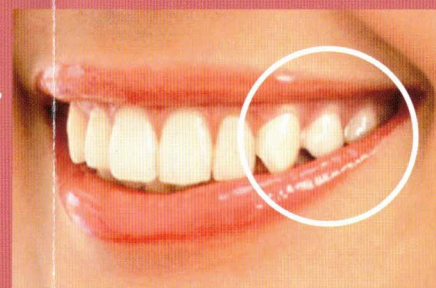
金属バネのない入れ歯