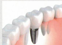
残った歯を長持ちさせる