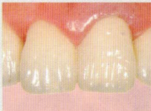
天然の歯の様な仕上がり