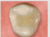
虫歯になりにくく きれいな仕上がり