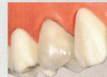
歯垢がつきづらく 歯にやさしい